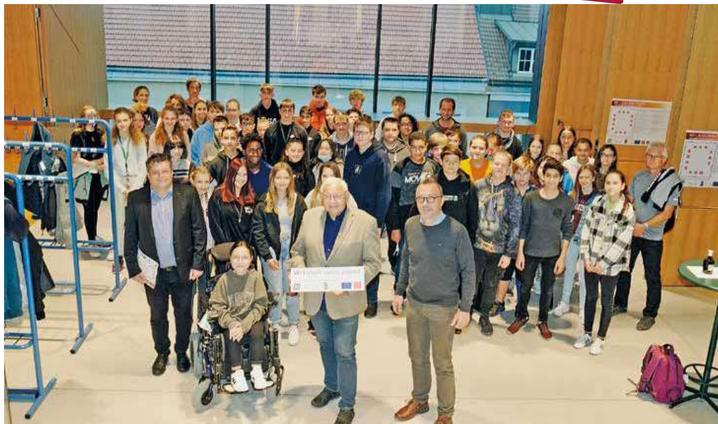
Bei der Lehrlingsbörse in Böheimkirchen konnte man in der Vergangenheit immer über 400 Schüler*innen begrüßen.